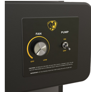
Control de velocidad variable integrado