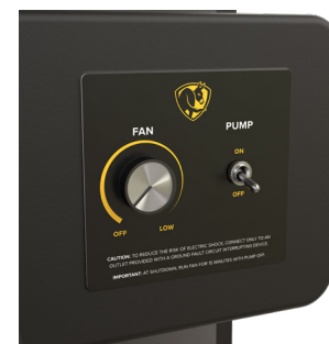
Commande intégrée à vitesse variable