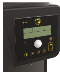
Panel de control integrado