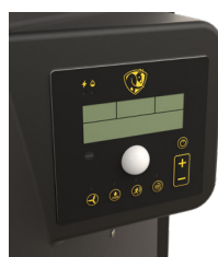
Panneau de commande embarqué