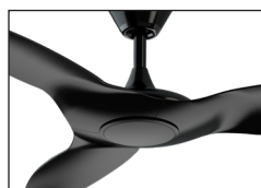
Finition noire avec lentille fumée